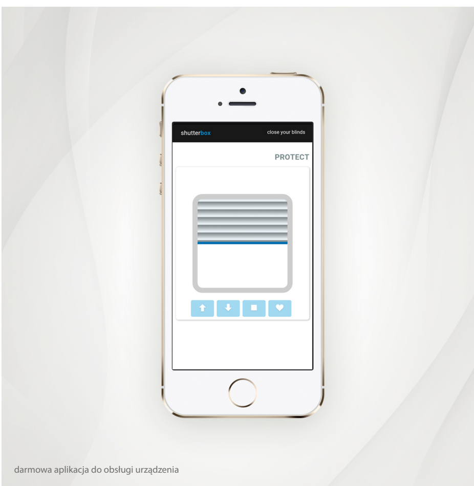
darmowa aplikacja do obsługi urządzenia

shutterBox to sterownik przeznaczony do sterowania bezprzewodowo napędami rolet elektrycznych, markiz, ekranów projekcyjnych, etc. z wykorzystaniem smartfonów i tabletów, również z dowolnego miejsca na świecie